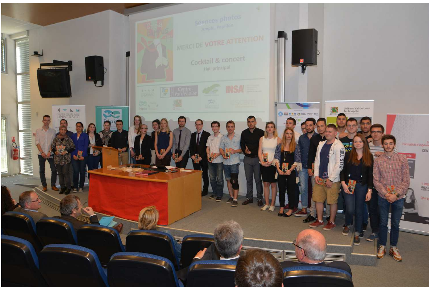
Les 12 équipes lauréates.