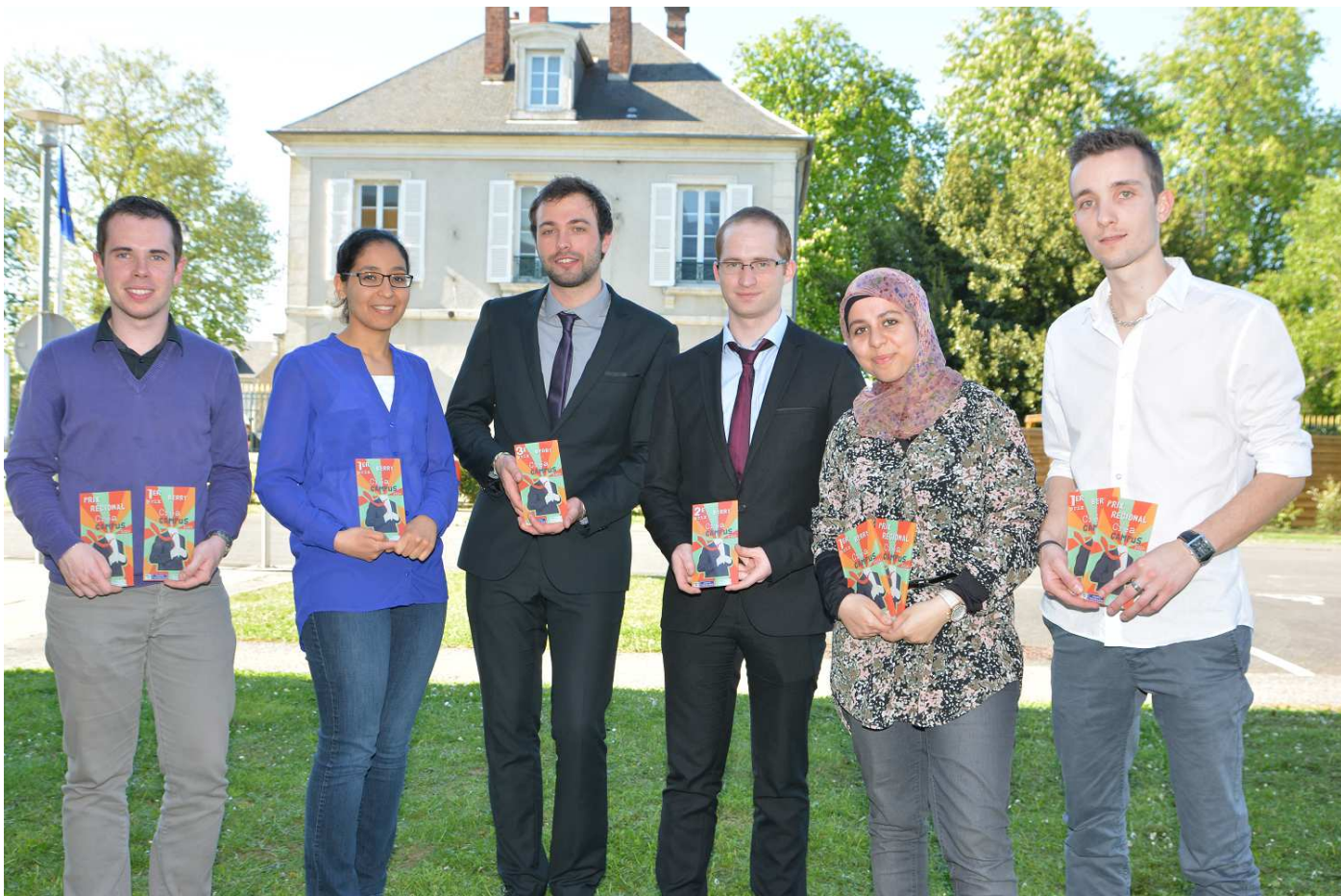
Les lauréats du Berry et du Prix Régional.